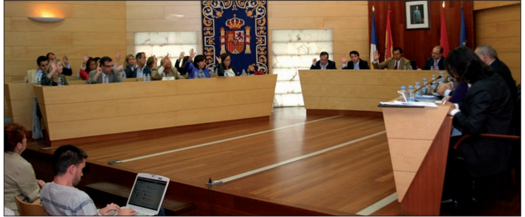
El Pleno de septiembre ha sido el primero que se ha podido seguir en directo a través de Internet.

El Pleno ordinario del Ayuntamiento aprobó el pasado 27 de septiembre, con los votos en contra de PSOE, UPyD e IU-LV, la propuesta de modificación de las Ordenanzas Fiscales para 2013, que establece, entre otras medidas, una bajada del 0,54% al 0,51% en el tipo impositivo del Impuesto de Bienes Inmuebles (IBI) para el próximo año y mantiene el resto de tasas e impuestos municipales por debajo del incremento del IPC.