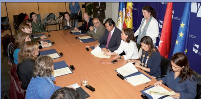
Imagen de la firma del convenio.

Con este convenio, el Ayuntamiento renueva su apuesta por la mejora constante de la educación en nuestro municipio, en este caso a través de unas actividades que redundan en la calidad educativa que se presta a los alumnos y facilitan la conciliación de las familias. En este sentido, el Ayuntamiento también ha destinado este año un total de 120.000 euros para contribuir a la mejora de la calidad educativa en los 17 centros públicos del municipio (diez colegios, cuatro institutos y tres escuelas infantiles), mediante actividades de refuerzo escolar, apoyo a servicios complementarios o compras de material escolar, ayudas de las que se benefician más de 8.000 alumnos.