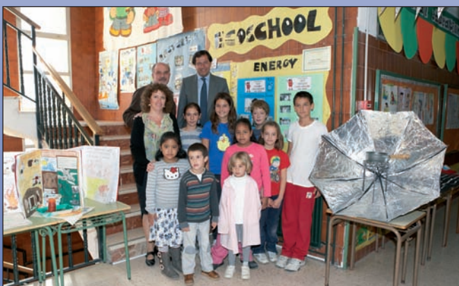
El alcalde felicitó a alumnos y equipo directivo del CEIP Vicente Aleixandre.

Las Ecoescuelas trabajan en colaboración con sus municipios en la aplicación de la Agenda 21, en especial en temas como el agua, la energía o los residuos.