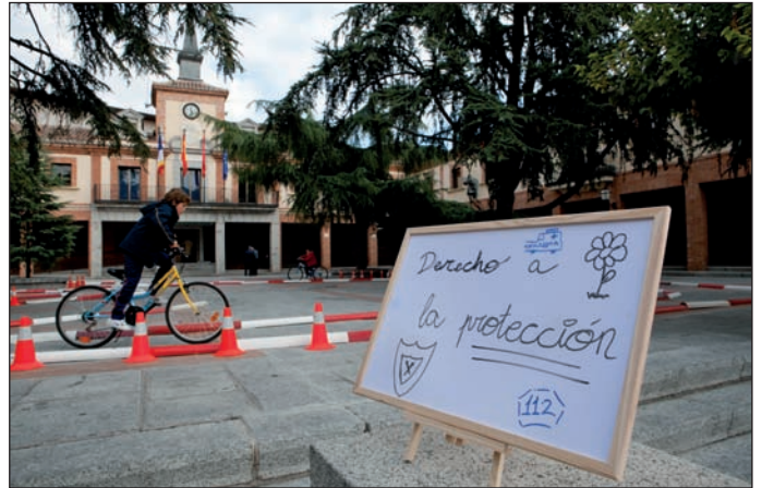
Gymkhana de los Derechos de la Infancia.

Se han programado además eventos como actividades culturales (Cuentacuentos, teatro infantil...), actividades de ocio para jóvenes, Talleres Solidarios, la Gymkhana de los Derechos de la Infancia, Me-