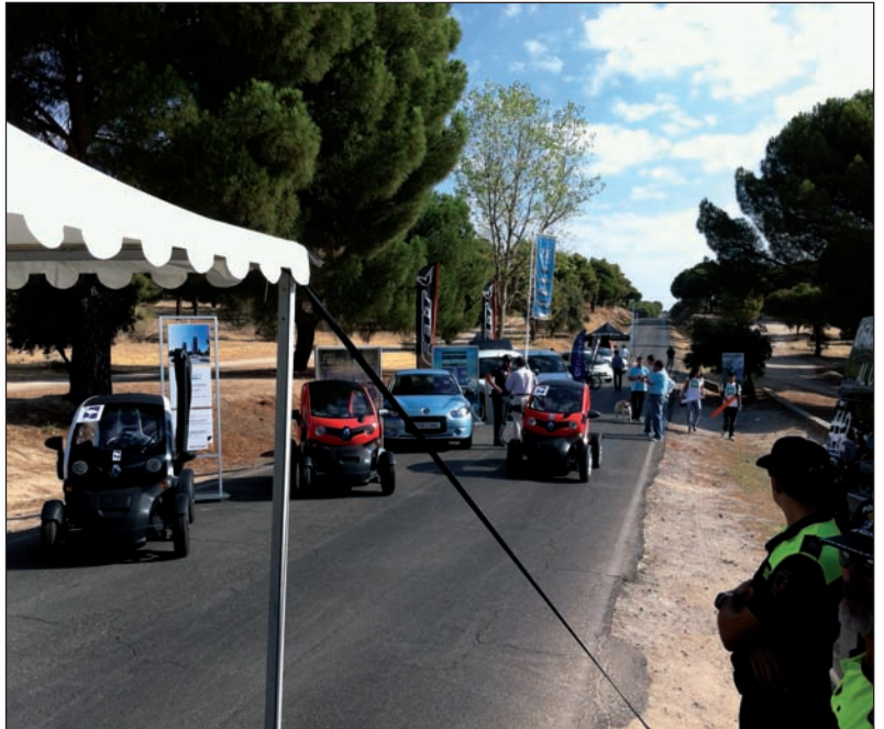
Vehículos ecológicos en la feria “¡La ciudad, sin mi coche!”.

La Concejalía de Servicios a la Ciudad preparó también una gran fiesta como broche final a las actividades de la Semana Europea de la Movilidad, la feria “¡La ciudad, sin mi coche!”, que se celebró en la calle Samuel Bronston, cortada al tráfico los fines de semana. En ella se dieron a conocer todas las acciones encaminadas a promover y potenciar la movilidad sostenible. Además de diferentes actividades para concienciar del importante papel que juega la movilidad sostenible en la protección del privilegiado entorno natural del municipio, el evento contó con un espacio dedicado al coche compartido, un circuito en el que se pudieron probar los últimos modelos de bicicletas convencionales, urbanas y eléctricas, y una exposición de vehículos ecológicos.