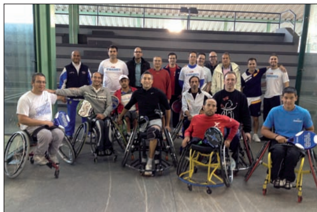
Participantes del Torneo de Pádel Inclusivo.

La Fundación Deporte Integra organizó en Las Rozas un Torneo de Pádel Inclusivo, una competición en la que participaron jugadores profesionales del circuito de pádel en silla de ruedas, junto con voluntarios de la empresa AvantCard. En esta modalidad el deportista en silla se pone a la altura y, en muchos de los casos, supera al deportista sin discapacidad. El principal objetivo de esta actividad es promover la integración social de personas con discapacidad a través de la práctica deportiva.