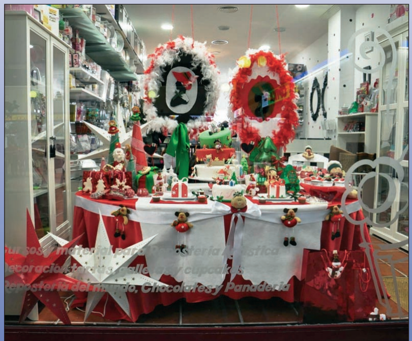
Escaparate de “Rincón Goloso”, ganador de la III edición

Las bases de este IV Concurso de Escaparates Navideños pueden consultarse en la web municipal www.lasrozas.es .