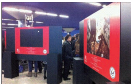
Exposición “Comparte tu Mirada”.

Selección de las mejores fotografías realizadas por alumnos de centros educativos de la Comunidad de Madrid, entre los que