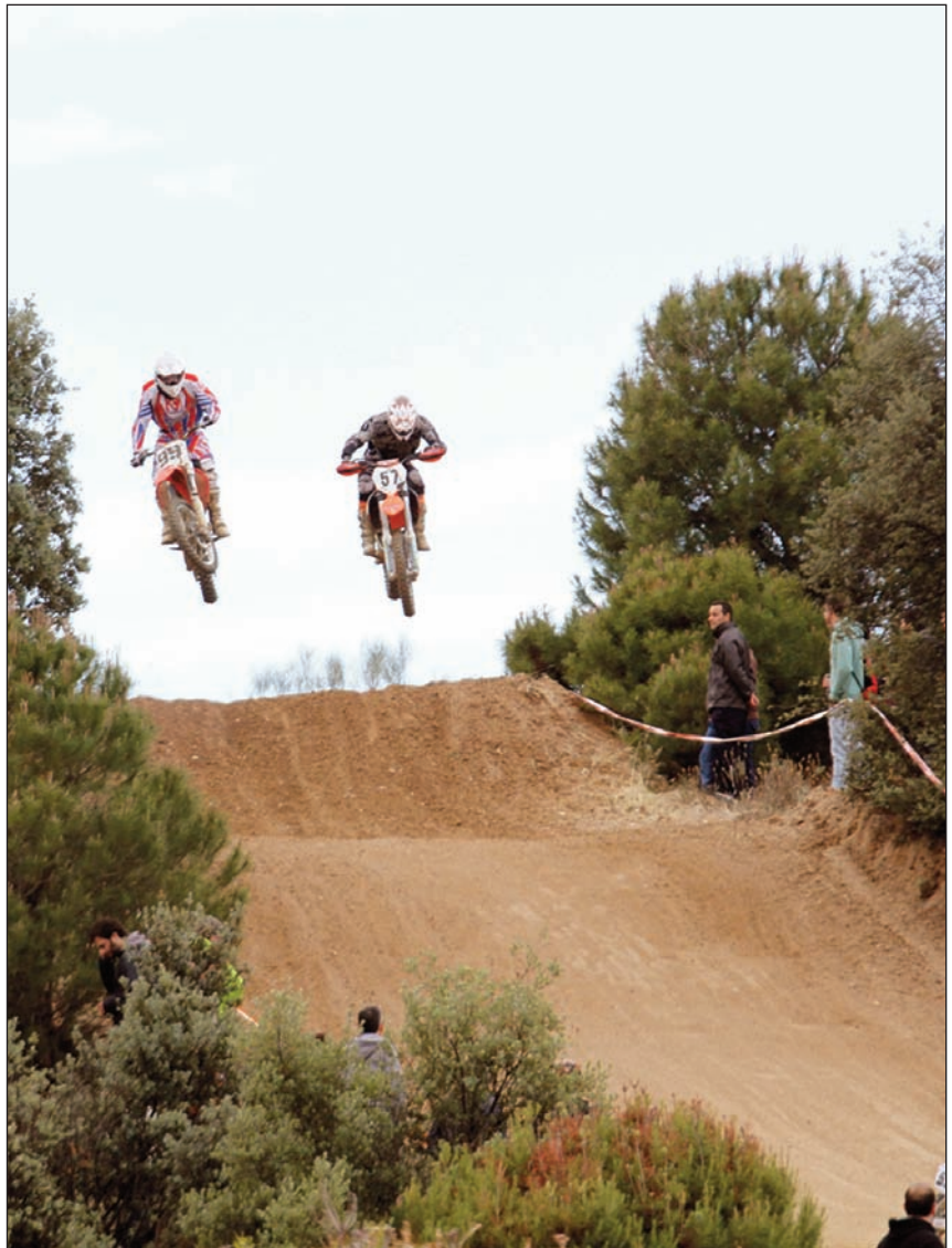
Más de 12.500 visitantes pasaron por la tercera edición de MotoEvent.

Las principales marcas del sector estuvieron presentes con sus últimos modelos, que los asistentes pudieron conducir por la pista de pruebas antes de que salgan a la venta en 2013. La industria auxiliar tampoco se perdió la cita y hubo expositores de moda motera, componentes, aceites y neumáticos, agencias de viajes, escuelas Off-Road, seguros, remolques o nutrición. Como novedad este año, la organización habilitó una Zona Outlet Moto de Ocasión que sirvió de escaparate para que tanto particulares como profesionales pudieran mostrar sus vehículos y ponerlos a la venta.