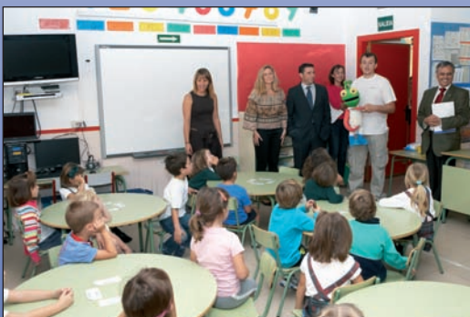
La campaña recorrerá los centros escolares del municipio.

Se estima que la mitad de los escolares de 6 y 7 años ya empieza a sufrir problemas de espalda, un porcentaje que se eleva hasta el 75% en el caso de los niños entre 12 y 15 años. La mayoría de estos problemas están ocasionados por una mala postura en clase o mientras estudian y juegan en casa. La patología más común es la escoliosis. Debido a la incidencia de escoliosis en menores, este programa tiene una segunda fase de intervención a través del Servicio Municipal de Rehabilitación de Columna con el objetivo de controlar el desarrollo de este trastorno y frenar su evolución en menores de 16 años. Dirigido por una fisioterapeuta con el apoyo de un monitor de natación para las clases en piscina, cuenta con la supervisión del médico de Salud Municipal.