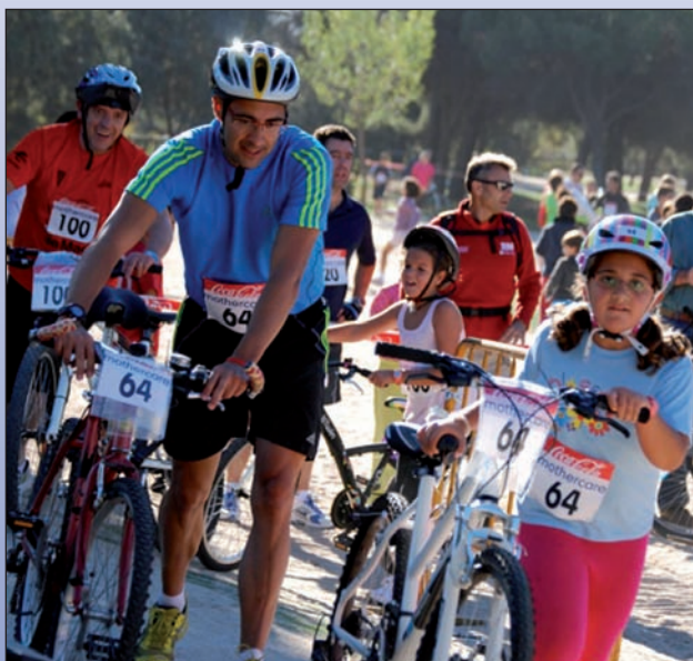
El III Duatlón Escolar se celebró en la Dehesa de Navalcarbón.

Cerca de 400 niños y padres se dieron cita el pasado 14 de octubre en la Dehesa de Navalcarbón para participar en el III Duatlón Cross Escolar. Organizado por las AMPAS de los colegios públicos de Las Rozas para fomentar la actividad física entre los niños y el contacto con la naturaleza, la jornada fue todo un éxito.