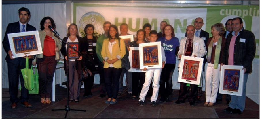
Imagen de los premiados por la ONG Humana.

Estos premios reconocen la labor de aquellos colaboradores públicos y privados que mejores cifras registraron en 2011 en lo que se refiere a la recogida de ropa y calzado usado. Las Rozas es uno de los ayuntamientos con los que esta entidad mantiene acuerdos de colaboración y que más ha contribuido en la recogida de ropa usada durante el último ejercicio, a través de los contenedores distribuidos en distintos puntos del municipio. Las Rozas suma ya numerosas distinciones por su labor en este campo; de hecho, el pasado año Humana entregó al Ayuntamiento el primer premio en la categoría de Mayor Responsabilidad socio-ambiental.