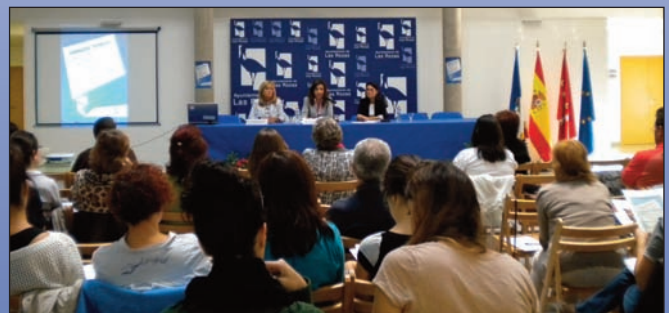
Las Jornadas se desarrollaron los días 4 y 5 de octubre.

Las Jornadas concluyeron con la exposición de las conclusiones elaboradas en los talleres y grupos de trabajo, que abarcaron temas como la programación y gestión de actividades de tiempo libre, estrategias de comunicación con personas mayores, nuevos retos ante la dependencia y envejecimiento activo.