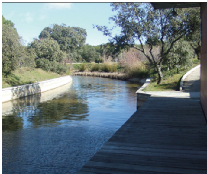
Canal de piragüismo de Navalcarbón

En estas visitas colaboran el CSIC (Consejo Superior de Investigaciones Científicas) y la Escuela Superior de Ingenieros de Montes de la Universidad Politécnica de Madrid.