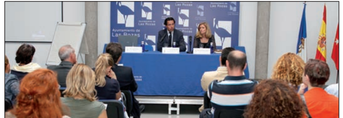
Las jornadas contaron con la participación de expertos en áreas relacionadas con la Salud Mental.

El Consistorio colabora estrechamente con dos importantes recursos ubicados en el municipio y dirigidos a personas con trastorno mental: el Centro de Rehabilitación Psicosocial (CRS), concertado con la Co-