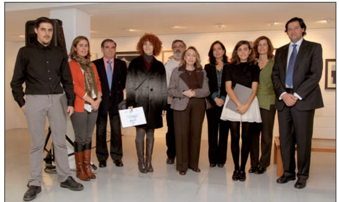
En la imagen, los ganadores de la última edición del Certamen

El jurado, tras seleccionar las obras de la exposición, otorgará un Primer Premio dotado con 3.000 euros por el Ayuntamiento de Las Rozas; un Segundo dotado con 1.500 euros por Las Rozas Village; y un Tercero de 1.000 euros otorgado por la Fundación Marazuela. Estos trabajos que pasarán a propiedad de las mencionadas entidades.